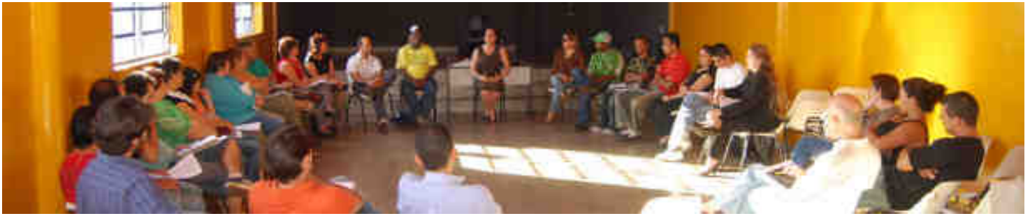
Workshop no Dia de Ação Cultural em Bauru.