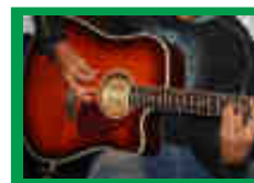
Sarau Arte da Cooperativa Cultural Brasileira [pág.07]

Jornal da Cooperativa Cultural Brasileira - Edição 01 - Ano I - Janeiro / Fevereiro de 2008